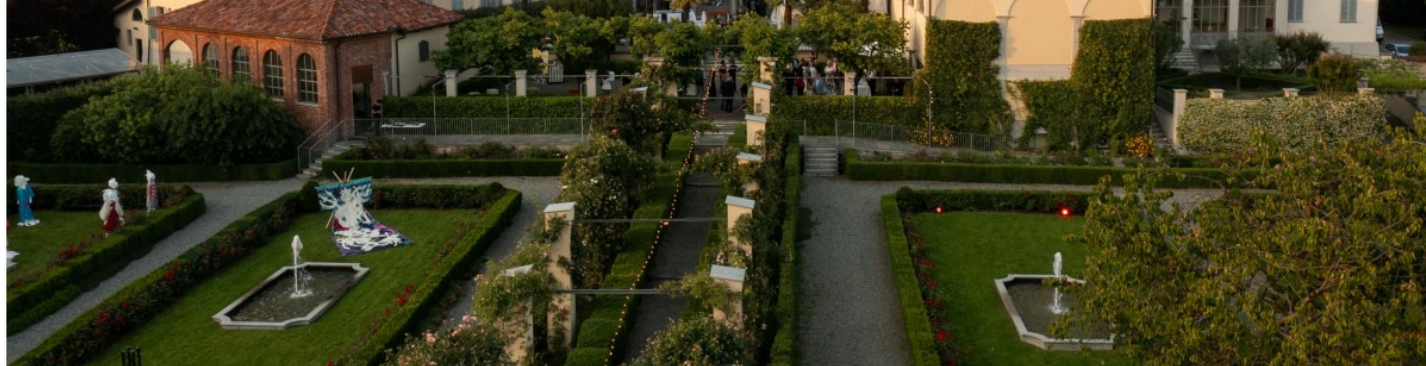
Palazzo Gromo Losa

Biella Wonderland. Where creativity and technology meet beauty è l'evento B2B internazionale promosso da Unione Industriale Biellese, in qualità di Official Supporting Organisation di ITMA 2023 (la più grande fiera internazionale al mondo di tecnologia tessile e dell'abbigliamento che si è tenuta a Milano dall'8 al 14 giugno 2023), dalla Regione Piemonte attraverso il Progetto Integrato di Filiera dedicato al settore tessile e realizzato da Centro Estero per l'Internazionalizzazione - Ceipiemonte . L'iniziativa è nata dal coinvolgimento attivo di imprenditori e aziende aderenti alla Sezione Meccanici di UIB, che in prima persona hanno ideato e costruito l'evento.